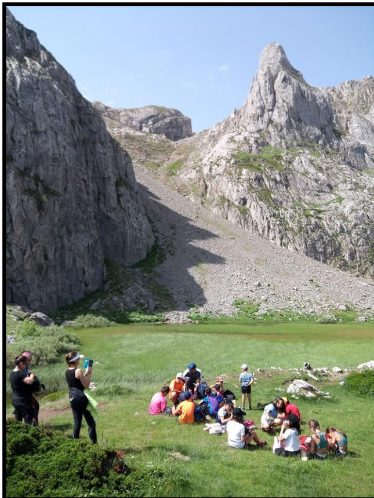
Imagen de la jornada:

LEONAVENTURA S.L. cuenta con número de registro TA: 24-027 en TURISMO ACTIVO de Castilla y León