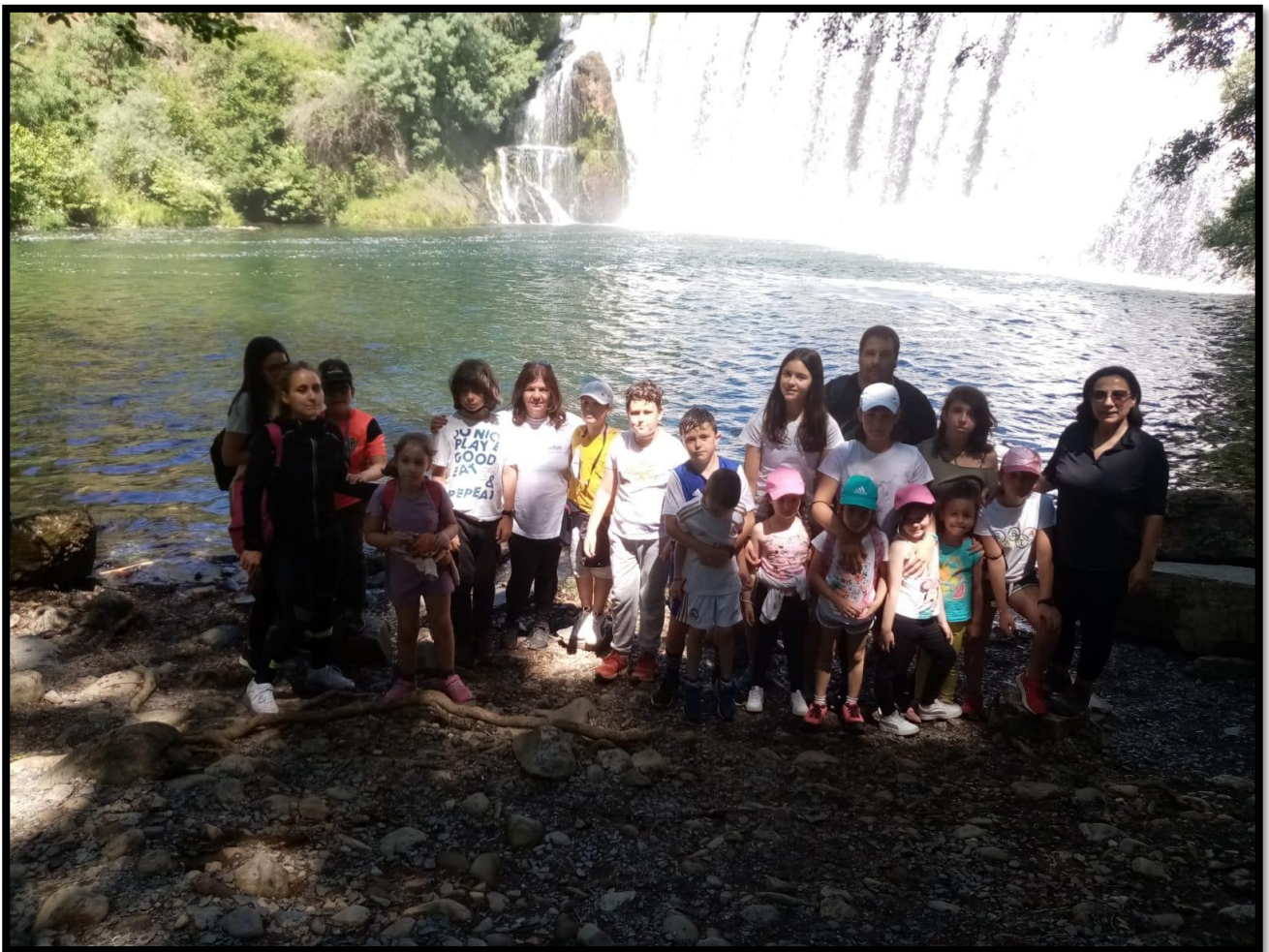
Imagen de la jornada: