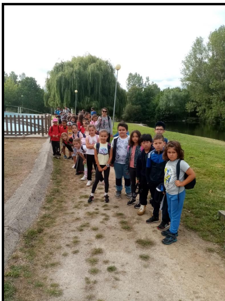
Imagen de la jornada: