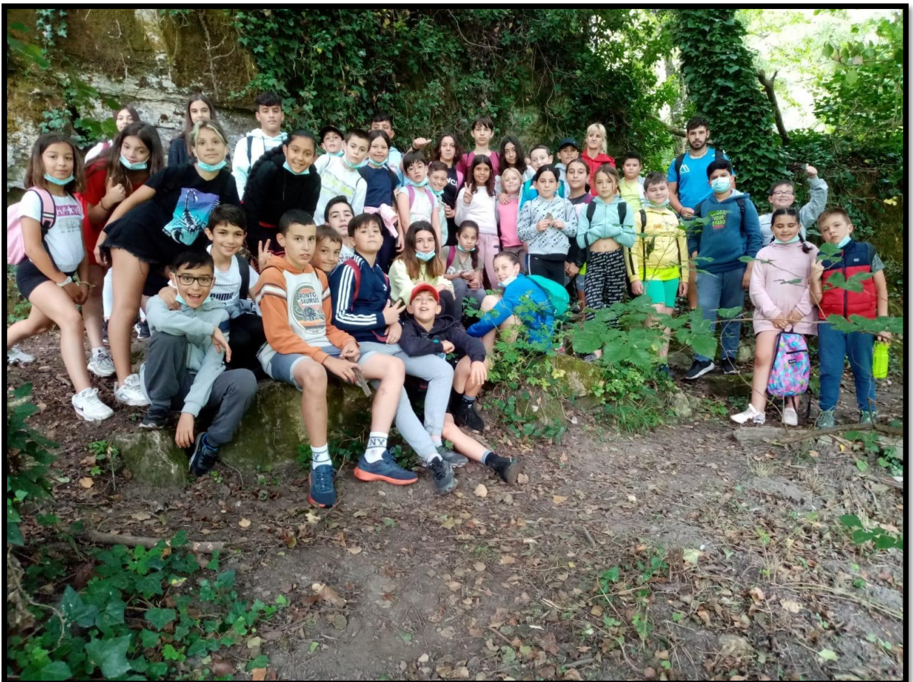
Imagen de la jornada: