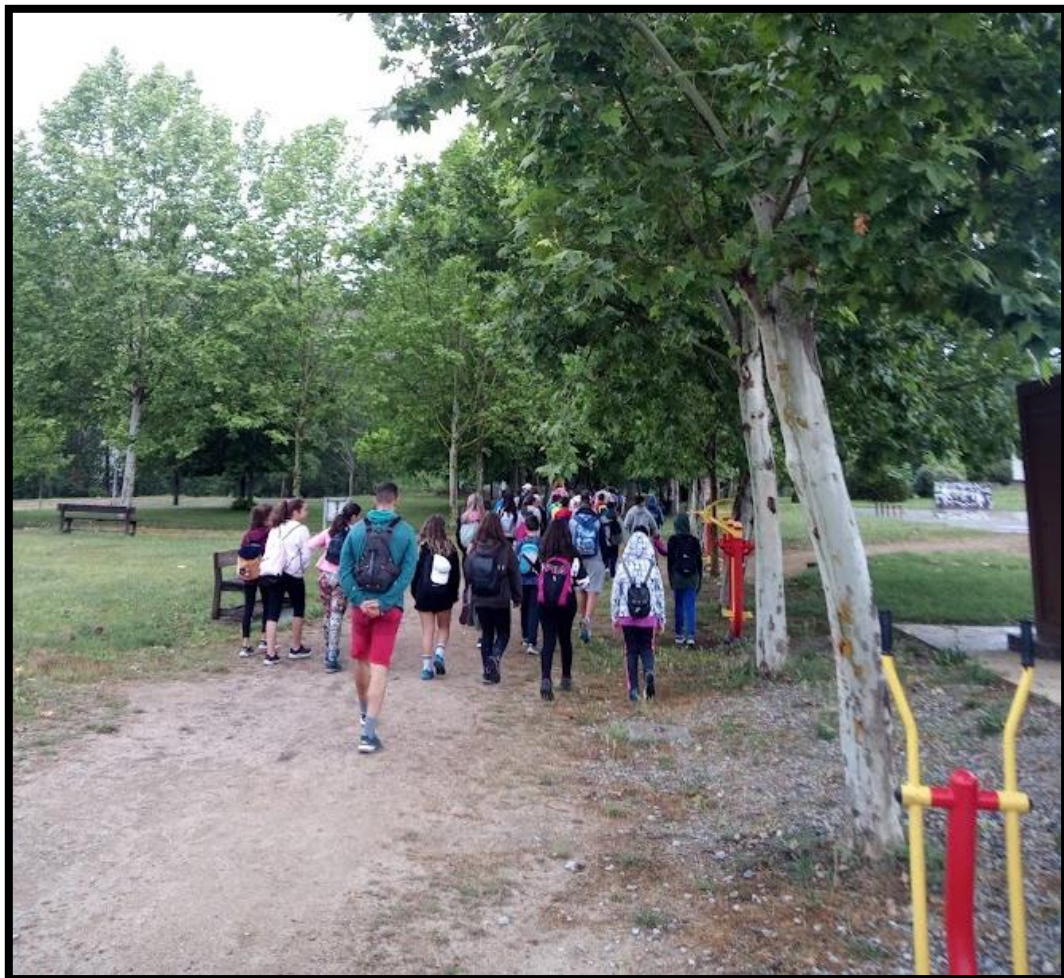
Imagen de la jornada: