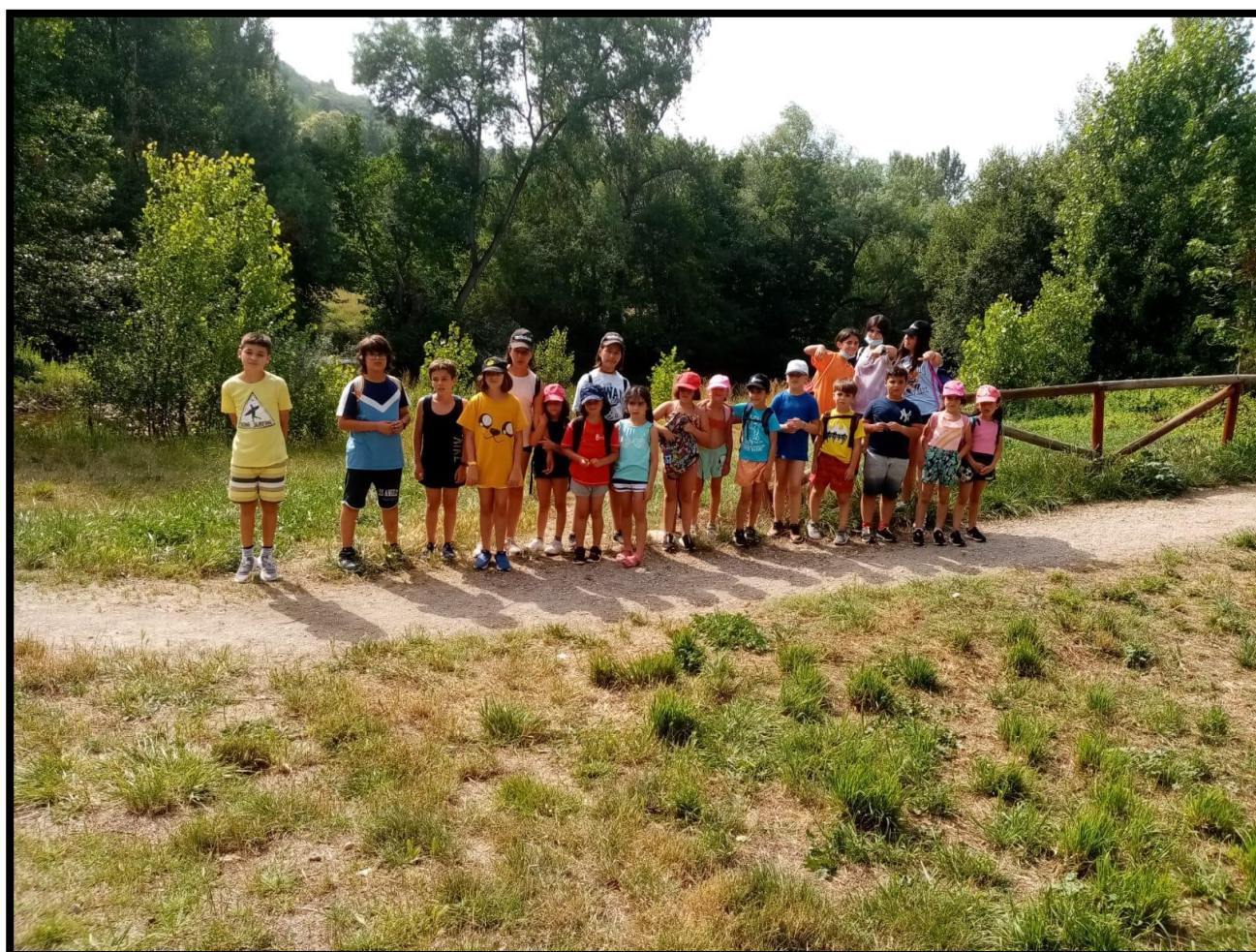
Imagen de la jornada: