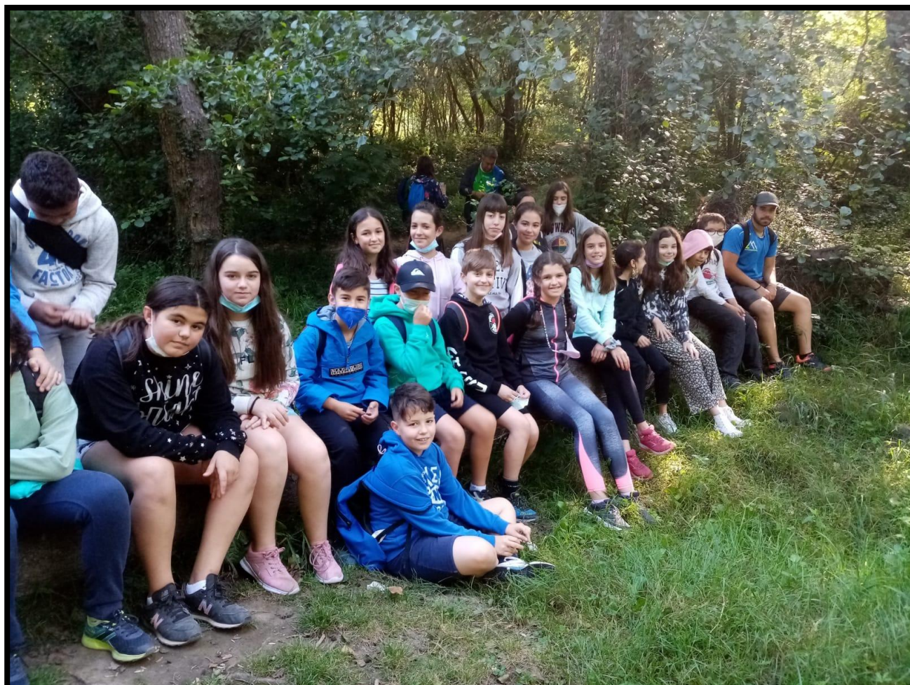
Imagen de la jornada: