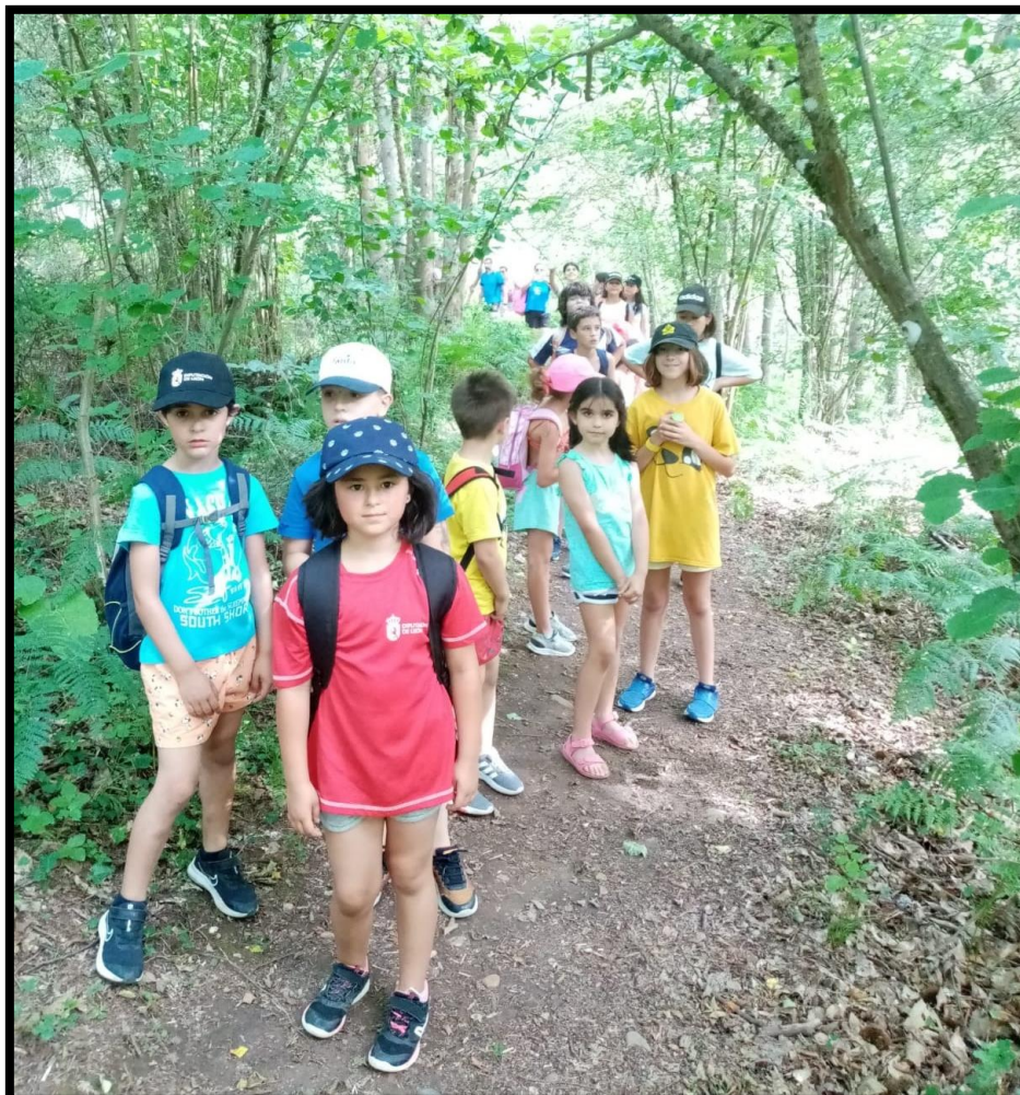
Imagen de la jornada: